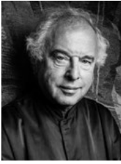
Sir András Schiff Klavier